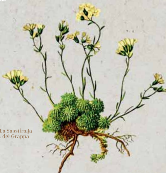
La Saxifraga del Grappa