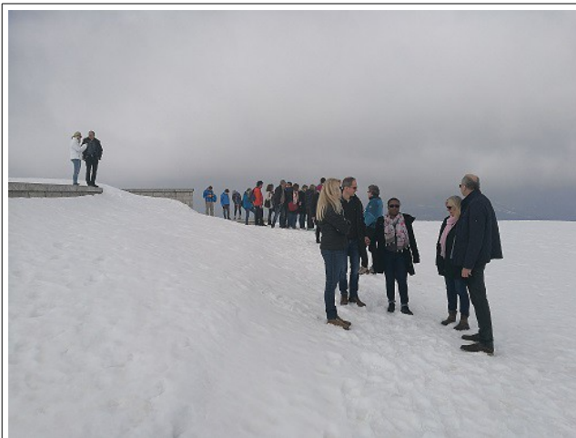
La tomba di Peter Pan non si trova