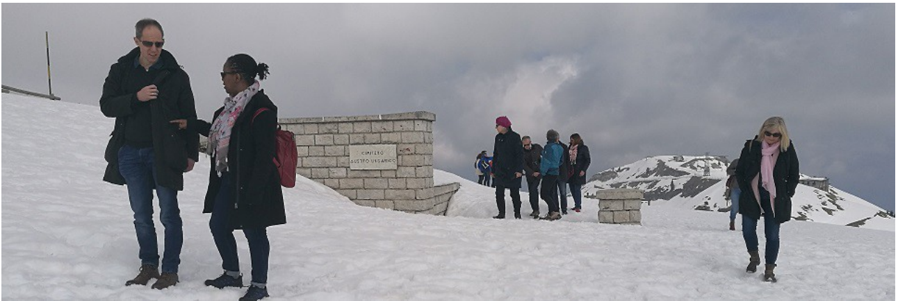
il Sacrario Austro Ungarico sepolto dalla neve