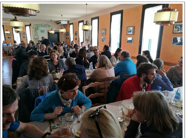
Alle 12.20 tutti a tavola al Rifugio Bassano