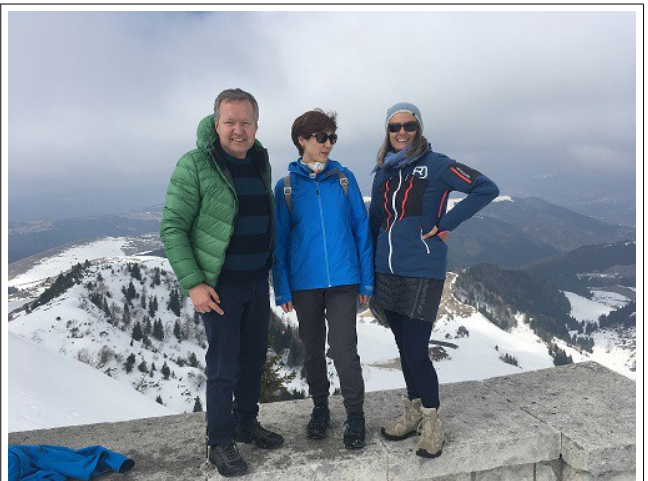
Achtung ... dietro c'è un salto di 50 m