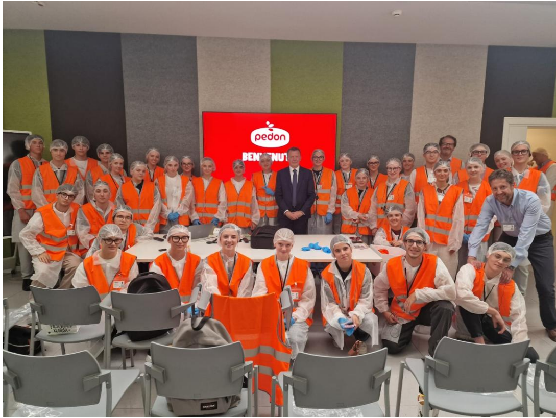
L'azienda Pedon spa