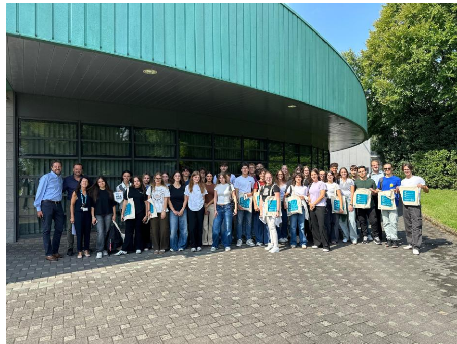
L'azienda Mevis spa