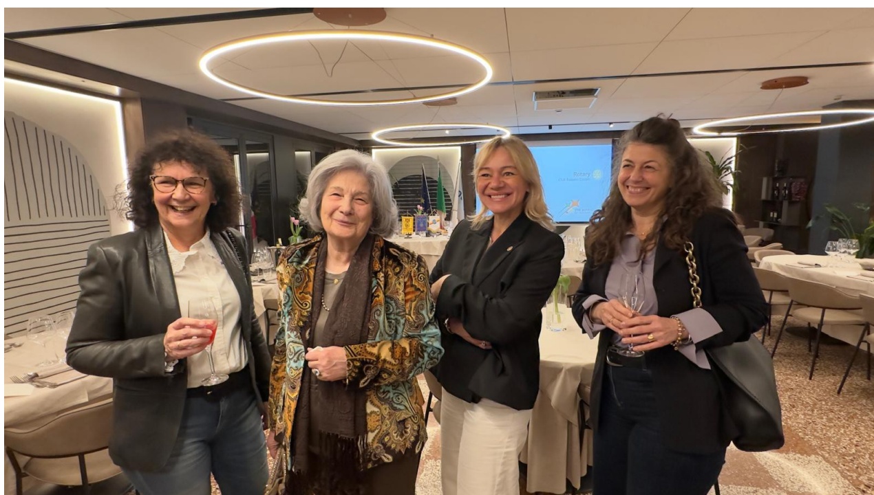
e per finire il bel sorriso corale al femminile